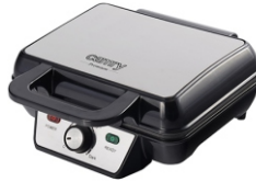
WAFFLE MAKER CR 3046