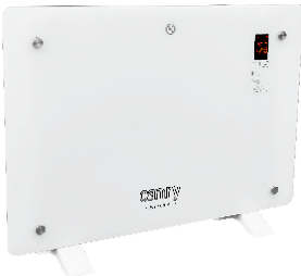
GLASS HEATER CR 7721