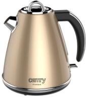
ELECTRIC KETTLE CR 1292