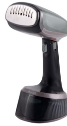
GARMENT STEAMER CR 5033