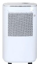
AIR DEHUMIDIFIER CR 7851