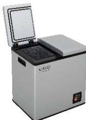
PORTABLE FRIDGE CR 8076