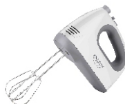
MIXER CR 4220