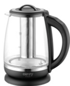
ELECTRIC KETTLE CR 1290