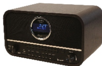
RETRO RADIO CR 1182