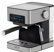
ESPRESSO MACHINE CR 4410