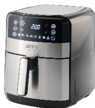
AIR FRYER OVEN CR 6311