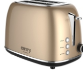
TOASTER 2 SLICES CR 3217