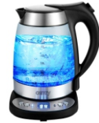
ELECTRIC GRILL CR 3044