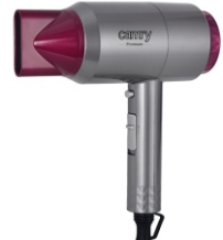
HAIR DRYER CR 2256