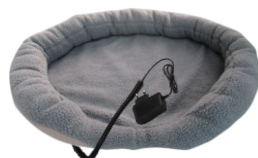
HEATED ANIMAL DEN CR 7431