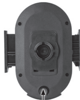
Przycisk do automatycznego wysuwania ramion bocznych

Umieść urządzenie w uchwycie a następnie delikatnie ściśnij boczne ramiona, aż do wycucia oporu. Sprawdź poprawne mocowanie telefonu w uchwycie, tak aby boczne trzymanie było stabilne i nie doprowadziło do wysunięcia się telefonu z uchwytu i jego uszkodzenia.