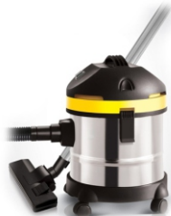
Canister vacuum cleaner AD 7022