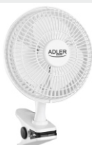
Desk fan 15 cm with clip AD 7317