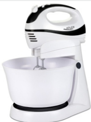
Mixer w/rotating bowl AD 4206