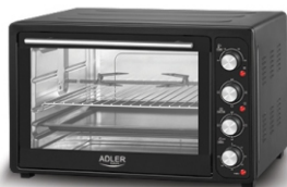
Electric Oven AD 6010