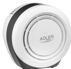
Air Purifier AD 7961