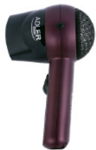
Travel Hair Dryer AD 2247