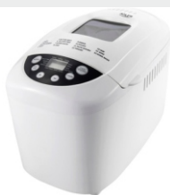
Bread Maker AD 6019