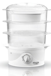
Steam cooker AD 633