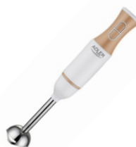
Hand Blender AD 4616