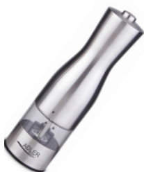
Pepper mill AD 4434