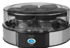
Yogurt Maker AD 4476