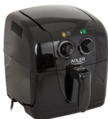
Air fryer AD 6307