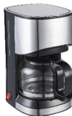
Dripp Coffe Maker AD4407