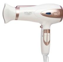
Ionic Hair Dryer AD 2248