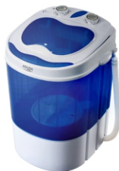
Mini washing machine with spinning function AD 8051