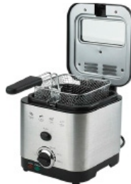
Deep Fryer AD 4911