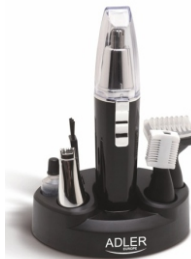
Trimmer AD 2907