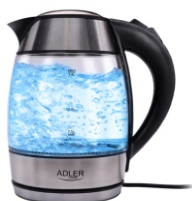
Electric kettle 1.8L AD 1246