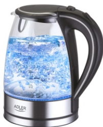
Electric kettle AD 1225