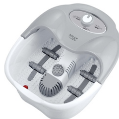
Foot Spa AD 2167