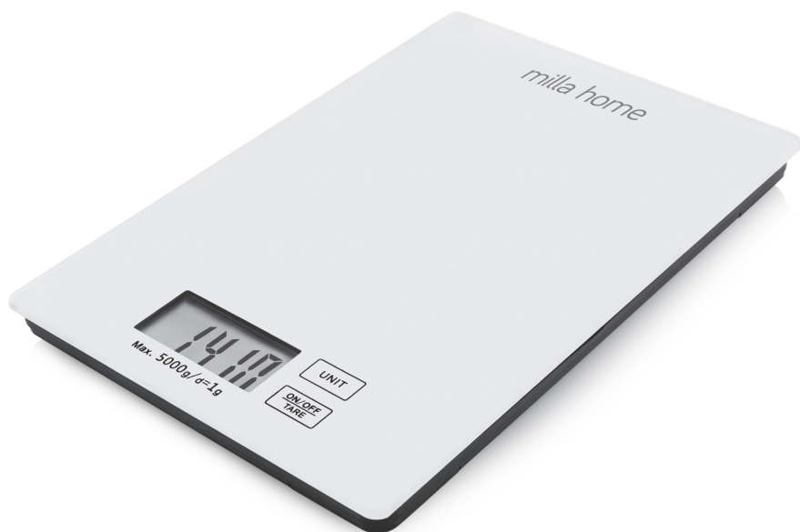
WAGA KUCHENNA MKS101